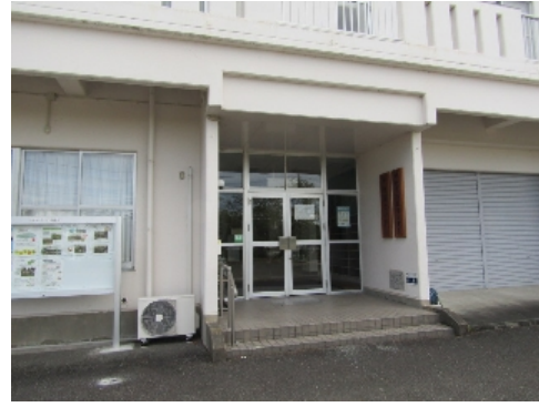
中地区コミュニティ防災センター